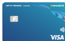
NHB - LOTTE Finance Visa Corporate