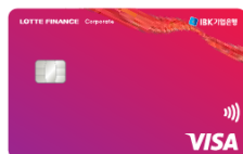
IBK - LOTTE Finance Visa Corporate